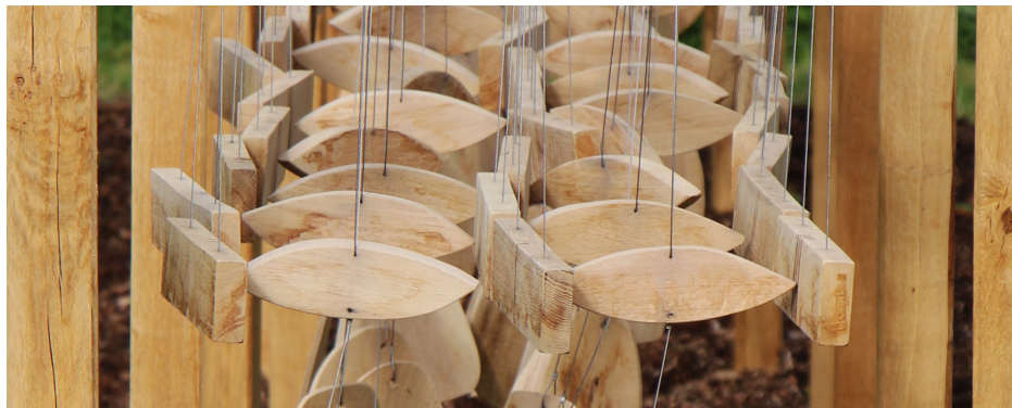
Chant sonore © Will Menter