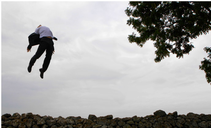
Paridi / Cie la vouivre